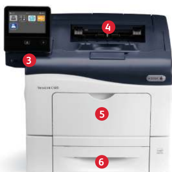
Xerox® VersaLink® C400 -väritulostin Tulostus.