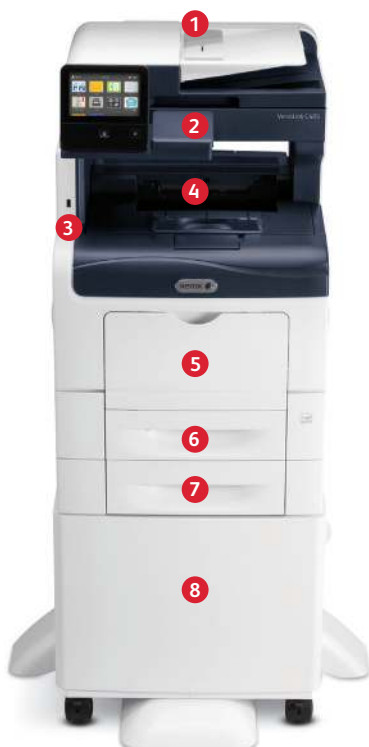
Xerox® VersaLink® C405 -värimonitoimitulostin Tulostus. Kopiointi. Skannaus. Faksi. Sähköposti.