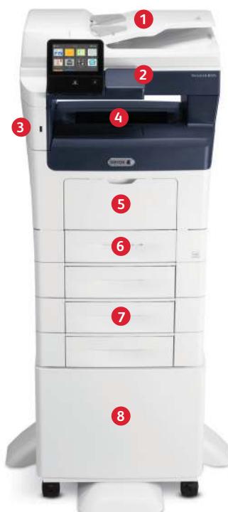
Xerox® VersaLink® B405 -monitoimitulostin Tulostus. Kopiointi. Skannaus. Faksi. Sähköposti.