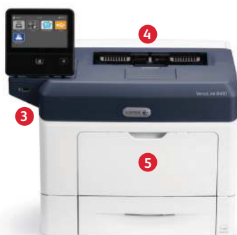
Xerox® VersaLink® B400 -tulostin Tulostus.

Tämä laitetekniikan ja ohjelmistollisen muokattavuuden verraton yhdistelmä auttaa kaikkia VersaLink® B400- ja VersaLink® B405 -käyttäjiä työskentelemään entistä nopeammin ja tehokkaammin.